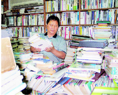
그림 12: 문화서점

편지도 있고 원고들도 있었어요. 황순구 교수라고 알죠? 그 양반이 그걸 알고는 사흘 내리 찾아와서 달라고 조르더군요. 그래서 넘기고 말았지요. 이호석의 엽서 한장은 기념으로 두고보려 했는데 그것마저 다 쓸어가버려 지금도 섭섭해요.