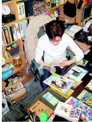
그림 8: 대양서점

포스터(고교알개)는 박줄 만하다. 풍년초 담배, 족제비, 고라니 박제에 이르면 사정이 달라진다. 군데군데 덧처럼 놓인 그것들은 눈 옆자위에 도사리고 있다가 조금 시선이 비껴나면 덮석 잡아끈다.