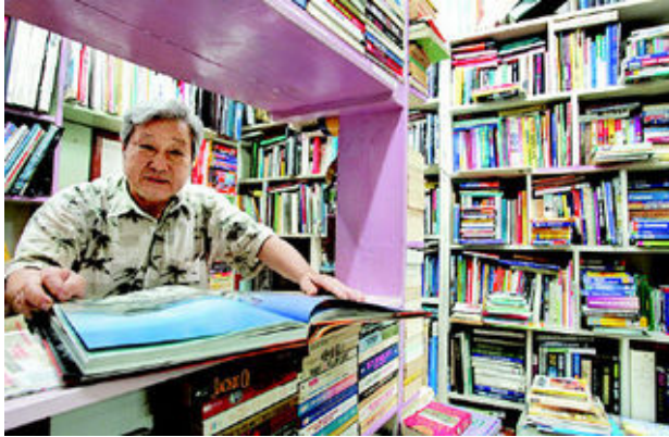
그림 18: 이태원 외국서점

서 물건을 만들었어. 세계 기능경기 대회에서 한국인들 입상한 뒤에는 나 같은 사람이 있었어. 말하자면 나는 애국자야.