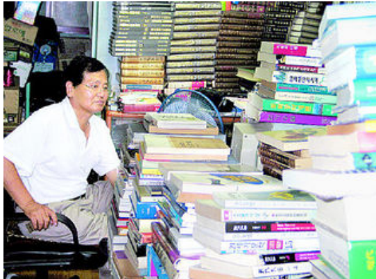
그림 14: 노벨서점