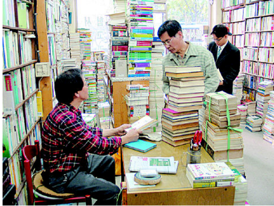
그림 23: 책방 진호

그는 싸게 판 책은 제대로 읽히지 않는다고 굳게 믿는다. 값싸게 만들어진 책 역시 지적 자원화하기보다 소모된다고 말했다. “묵직한 책이 잘 안 팔려요. 가볍고 표지가 싹박한 것을 많이 찾습니다.” 그래서 사회과학 분야를 찾는 손님은 한번 더 본다.