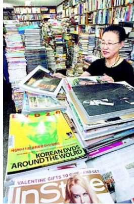
그림 5: 고래서점

작한 원조. 숙대입구역은 동생인 순운(52)씨의 새책방, 온라인은 아들이 4년 전 시작한 헌책방이다.