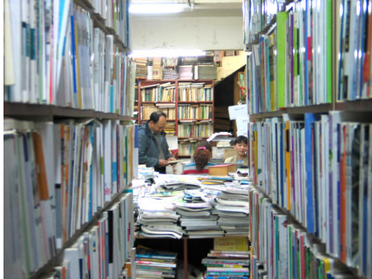
그림 49: 남문서점

좁은 바닥에서 소화할 수 없다는 판단 때문. 지금은 지하 60평 매장에 발안동에 100평 창고를 갖고 있는데 1년 전만해도 따로 일층 매장이 있었다. 2003년 시작한 인터넷이 자리잡으면서 굳이 지상매장을 유지할 필요가 없다는 판단이었다. 젊은 만큼 시기마다 적절한 판단으로 업태를 바꿔왔다.