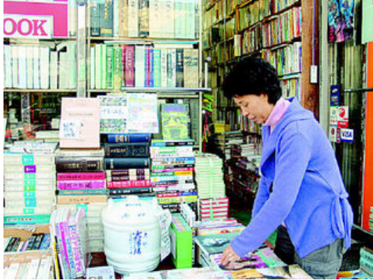
그림 32: 책나라