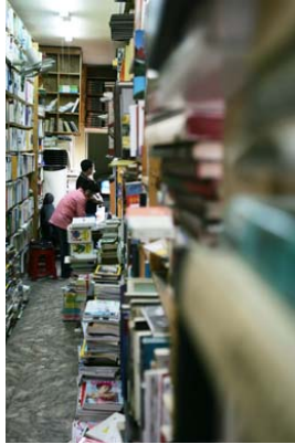
그림 1: 영광서점

배가 맞으면서 일어나는 자잘한 일들에 관한 총체적 사유다. 지난 주에는 《한자고음사전》(버나드 칼그렌, 아세아문화사 영인, 1975)이 눈에 띄었다. 책값은 낮은 편이다.