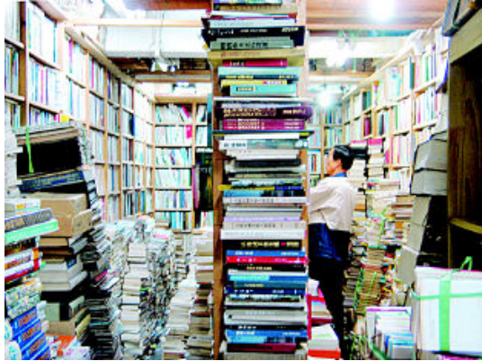
그림 20: 뿌리서점