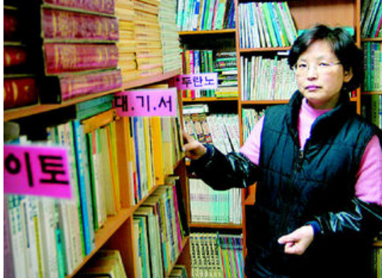
그림 33: 크리스천 중고서점