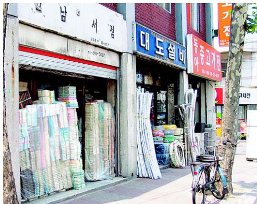
그림 2: 연남서점