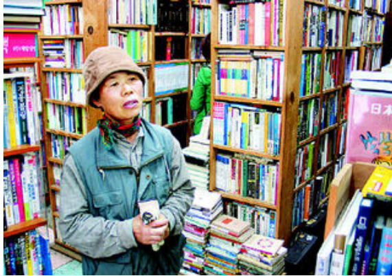
그림 25: 인천 배다리 아벨서점

“책은 예우받아야 합니다. 사실의 기록이기 때문이죠. 연애소설에도 시대상이 반영돼 있어요.”