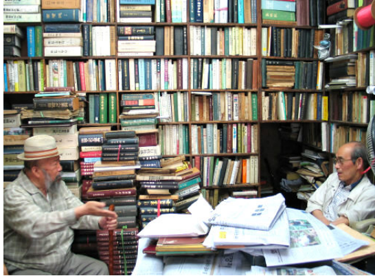
그림 51: 경안서림

35년 넘게 이곳을 지켜온 김씨는 산전수전 다 겪은 노장. 별 희한한 자료가 그의 손을 거쳤다. 새 자료임에는 틀림없지만 결코 공개할 수 없는 것들도 수두룩하다. 손기정의 올림픽 마라톤 제패를 기념해 1936년에 만든 양정교지. 거기에는 손씨의 일문 여행기, 교장(안종원)의 일문 찬시, 명사 33인의 와카(和歌) 한수씩이 실렸다. 창씨개명 관련 서류, 어느 문중에서 발행한 창씨개명 족보 등도 쉬쉬할 뿐이다.