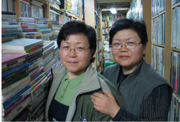
그림 43: 상계 책백화점

타이 아니라 책더미의 난시간성 탓인 까닭이다. 《건축, 음악처럼 듣고 미술처럼 보다》(서현, 호형출판), 《중국고대음악사》(양인리우, 솔), 《검은고독 흰고독》(메쓰너, 평화출판사)은 틈입자를 장르와 시간과 공간의 현묘한 경계로 이끌지 않겠는가. 20여평 사방 책벽에 2×2 서가가 레일식 책꽂이 또는 허리춤 쌓기로 두겹씩이다. 중고교 교과서·참고서와 일반서적이 반반이다.