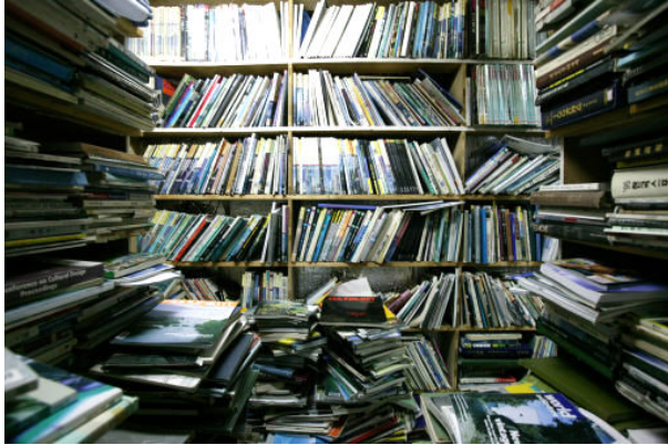
그림 30: 헌책방 순례 되돌아보기