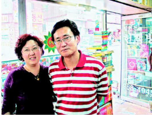
그림 19: 집현전