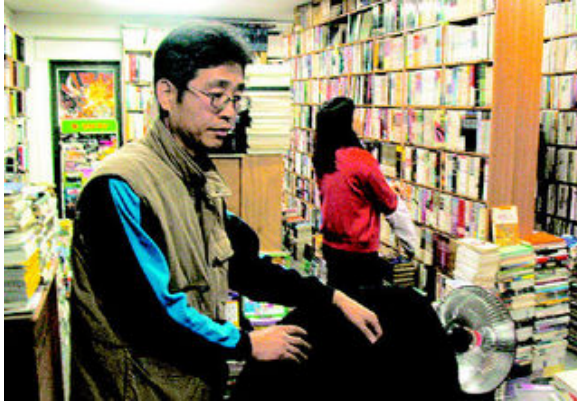
그림 34: 모아북

마포구 성산동 모아북(02-324-8789)의 저녁 7시는 한산하다. 문 닫을 무렵이려니와 배송료를 아끼려는 손님이나 동네사람 또는 단골이 들를 뿐 굳이 찾아가기 어려운 곳에 자리잡은 탓이다. 지하철 2호선 홍대입구역과 월드컵경기장 중간, 찾기는 쉬운데 큰길에서 서점까지 낙차가 무척 크다.