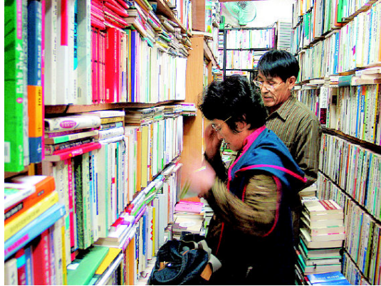
그림 24: 신림 현대서점