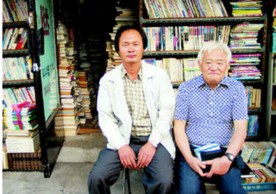
그림 22: 삼선서림

4년 전 “그런 책을 보는 사람이 책값 깎아서는 안된다”며 당당하던 이씨가 목소리에 힘이 없다. 연말까지 가게를 비워달라는데 마땅한 데가 나설지 걱정이 다. “아들이 물려준대도 싫대요. 아버지대로 끝내라면서요.” 그는 ‘더 들을 얘기 있어요?’ 하면서 전화를 끊었다.