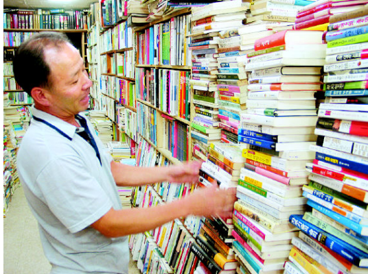
그림 17: 신광헌책