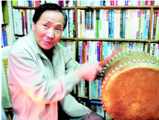
그림 27: 굴다리 헌책방

굴다리 헌책방은 상호가 없다. ‘헌책 사고팝니다’라는 메시지와 전화번호가 붙어 있을 뿐, 현재의 호칭은 그냥 사람들이 그렇게 부를 따름이다. 철길을 마주한 책방은 오른쪽으로 네개의 음식점을 거느리고 있다. 돼지껍데기를 안주로 하는 소주와 막걸리가 주메뉴다. 거느리고 있다고 표현했거니, 그것은 낮동안에 만 유효하다. 가난한 월급자들이 하루일을 마치고 모여들어 흥성스런 술판을 벌이면 책방은 음식점의 끝에 붙어 그 존재가 가뭇해진다.