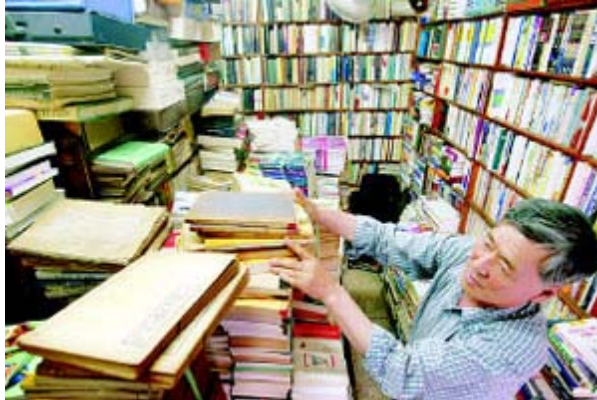
그림 4: 혜성서점

책들을 털어내고, 강남으로 이사가는 사람들 역시 그 책들을 버렸다. 책방으로서는 노다지였던 셈. 그러나 엄청나게 쏟아지던 고서는 공사가 마무리되면서 뚝 끊겼다. 요즘은 고서보다는 헌책을 더 많이 취급하게 되었다.