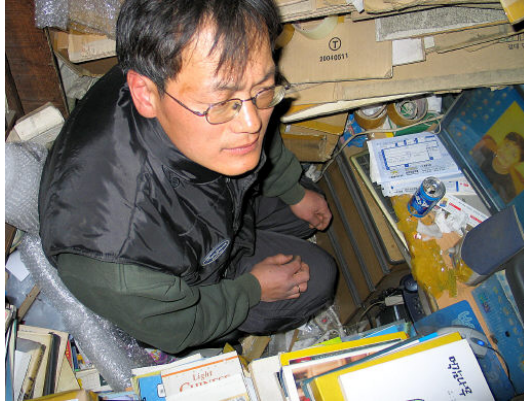
그림 46: 북마트

에는 온통 담배연기처럼 책이 가득했다. 14평 공간을 스무평처럼 써 2만5천권이 쟁여 있다. 그가 앉아 일하던 자리는 변함 없건만 켜켜이 책이 쌓이고 포장지가 뒤덮어 여우굴처럼 어둡고 비좁은 가운데 모니터 화면이 유독 퍼랬다. 그곳에서 낮에는 책 구입·포장·배송하느라 바쁘고 밤에는 입력하여 40권 정도 올린다. 안주인은 늦둥이를 돌보느라 모든 게 윤씨 혼자 몫이다.