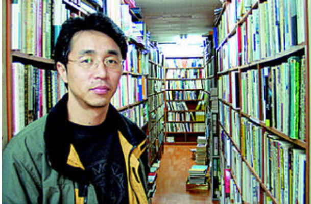
그림 26: 인천 부개동 책사랑방

손님은 하루 다섯 명 안팎이다. 오씨는 “월세 내고 책 사들이고, 손님과 탕수육도 시켜먹지 않느냐”며 느긋하다. 애초 온/오프 겸할 생각이었는데 자리가 외지고 2층이어서 온라인에 주력한다.