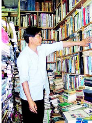
그림 6: 작은우리