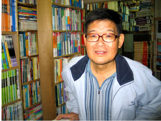
그림 48: 아단문고

또는 기둥에 달아매어 고서 전시장도 겸한다. ②는 직원만 출입할 뿐 공개하지 않는다. 온라인 판매를 겸하는 책방의 창고가 매장의 확장형인 까닭에 분류방식이 매장과 같지만 이곳은 완전히 다르다. 창고에 가득한 책꽂이는 깊은 선반형태. 30여권씩 보관되는 사각형 분할공간에는 각각 주소가 매겨져 있다. 예컨대 ‘가-3-1’이라면 ‘가열-셋째칸-위에서 첫번째 공간’이라는 뜻이다. 책에는 분류, 가격 외에 주소 정보가 부여된다. 소팅이 쉽게 가능한 컴퓨터의 장점을 최대한 활용하고 인력의 활용 또한 극대화하는 방식이다. 온라인 손님한테는 분야별 소팅된 목록이 노출되고, 책방에서는 책의 주소로써 상품을 찾아 배송할 뿐이다. 그런 창고가 셋. 각각 가나다, 꽃이름, 동물이름 등으로 구별한다. ③은 연립주택의 방 두 개를 가득 채운 것. 주인도 무엇이 얼마나 들었는지 잘 모른다.