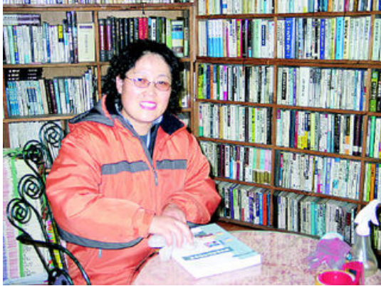
그림 39: 가자헌책방