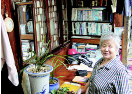
그림 9: 대오서점