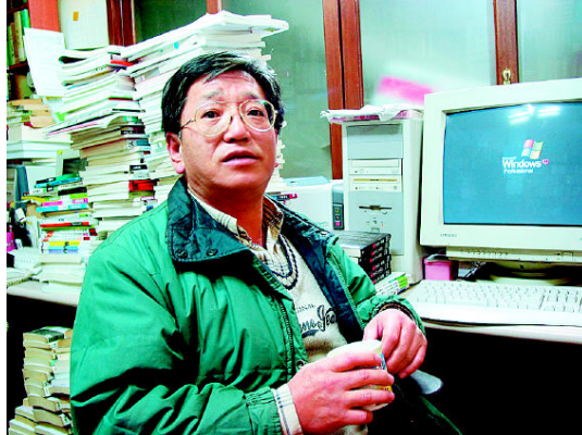
그림 29: 책의 향기