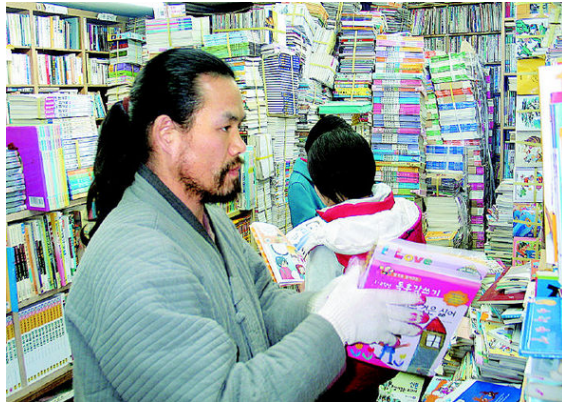
그림 40: 서적백화점