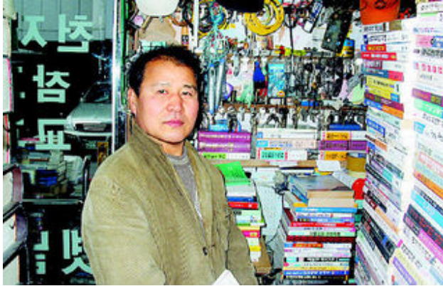
그림 36: 천지서적

후문 근처 가정집을 사글세로 얻어 헌책과 고물장사를 했다. 째잘했다. 하지만 “형아들이 취패고 돈을 빼뜯어가고” 때로는 문을 부수고 물건을 가져갔다. 나이 들면서 차츰 자리가 잡혔고 돈도 모였다. 서른 살에 “뽕갈 만큼 글씨를 잘 쓰는” 처자와 결혼했다. 그렇게 헌책방 35년. 버젓한 점포, 단독주택에 장성한 두 아들이 있다.