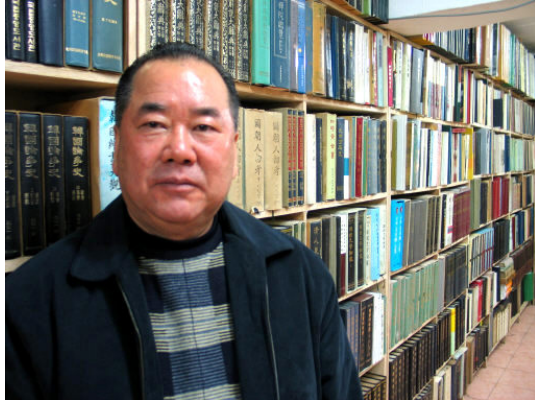
그림 44: 동국서적