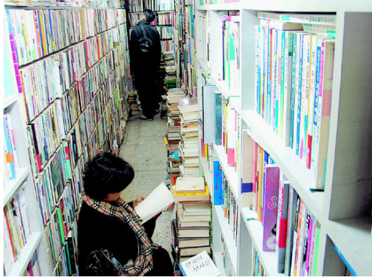
그림 41: 할

어붙인 차양 아래 책꽂이의 책들이 막 달아낸 조화처럼 선명하다. 새 헌책을 툭툭 좌판에 던지는 사내의 완강함과 겹쳐 ‘할’은 쉽게 속을 내줄 것 같지 않다. 세로로 긴 사각형 책벽 가운데 두 줄의 책꽂이를 두었고 높은 공간 위쪽을 툭 잘라 다락을 들였다. 분야별로 잘 정리되어 허투루 빼어들어 뒤적거리기 민망하고, 눈높이를 중심으로 완급을 두어 손님의 시간차까지 계산한 흔적이 뚜렷하다. ‘잘 빛은 향아리’ 같달까.