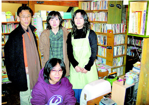
그림 35: 뿌리와 새싹

수 있는 다구가 진열돼 했다. 테이블과 의자가 없다 뿐, 그냥 북카페다.