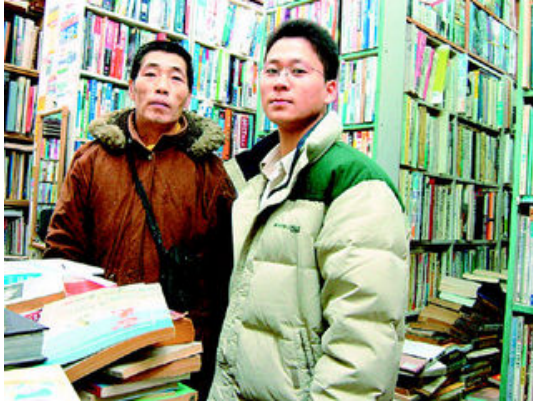
그림 31: 의정부 헌책백화점

3-4년 전에 두 군데가 없어지고 부근에서 유일하게 남은 헌책방. 이곳은 학생들의 발길이 잦다. 학기 초와 말은 그야말로 학생들이 큰 손님이다. 서울과는 달리 학생들이 헌책으로 공부하기를 스스로없어 하고 학기가 끝나면 팔기도 주저하지 않는다. 의정부스런 표정 아닐까.