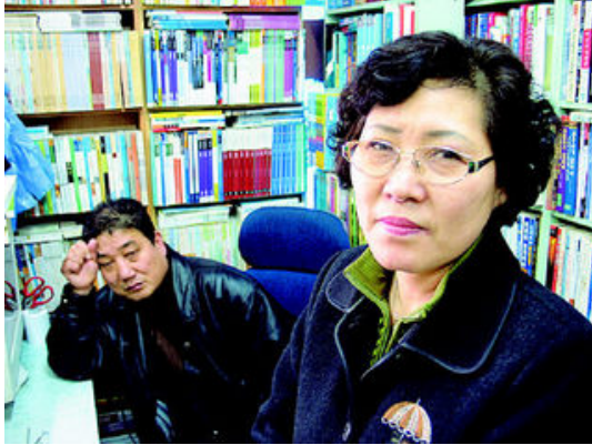
그림 38: 태인서점

3학년이다. 책을 팔면서 버릇처럼 딸 얘기를 한다. 사람은 책을 많이 보아야 공부를 잘 한다고.