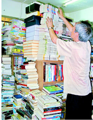
그림 11: 신촌헌책방

었다. 채규엽의 에스피 음반 《순풍에 돛달고》 《권농가》도 있다면서 목록을 보여주었으나 가격은 굳이 말하지 않았다. “집에는 이보다 더 썩 것 3천권쯤 있는데 팔지는 않는다”고 말했다. 결코 닿을 수 없는 가격 너머의 책 구경은 복이가기보다 기이함에 가까웠다.