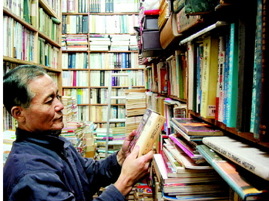
그림 28: 정은서점

다. 지난 10월 매출이 10년 전인 95년 10월치에 훨씬 밑돌았다. 그렇지만 그 동안 책방 보증금은 세배, 월세는 두배로 올랐다. 올들어 책을 한 권도 못 판 날도 있었다. 생전 처음 겪는 일이다. 69년 첫 직업으로 택한 이래 36년 동안 자신의 이름으로 가게이름을 쓸 만큼 열심이었고 책을 돌리는 일을 ‘문화사업’이라고 자부해온 터에 황당하다. 지난 환갑날도 도시락을 싸들고 책방에 나왔다고 했다.