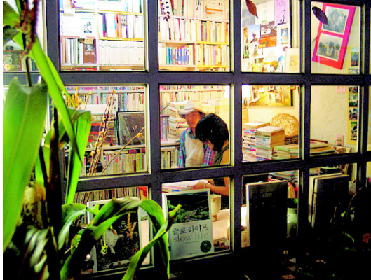
그림 16: 캘커타

난 탓일까, 아니면 95년 캘커타에서 자원봉사하면서 체득했다는 ‘봉사의 익명성’ 탓일까.