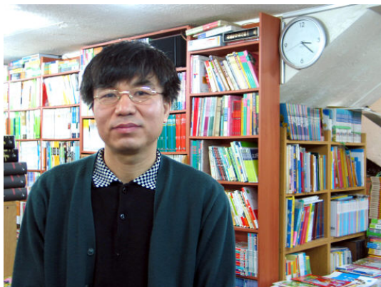
그림 50: 오복서점

주인처럼 책들도 허투루 꽃힌 게 없다. “책방주인은 물건으로 얘기해야 한다”는 그는 한권이라고 손님들이 사갈 만한 내용과 깊이있는 책을 갖췄다고 말했다.