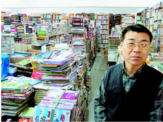
그림 37: 책읽는 마을