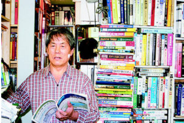
그림 21: 진주 '소문난 서적'