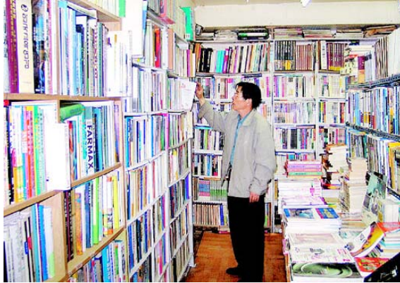
그림 3: 우리서점

조금 다른 표정이 바로 그런 탓이다. 글벗사. 어린이책과 문학 관련 책 1천여 종을 냈다. 《건국대통령 이승만》(이종구 지음)이 최근작이다. 출판사 명패가 달린 작은 방 컴퓨터는 먼지를 썼고 아들이 업데이트한다는 사이트(gulbutsa.co.kr)는 한산하다. 구제금융 사태가 터지면서 시난고난 출판사는 시들고, 급기야 5-6명 직원을 모두 정리하고 집을 팔아 전세로 옮기며 빚잔치를 했다. 출판사 이름을 유지한채 일감이 들어오면 아르바이트를 써서 책을 낼 따름이다.