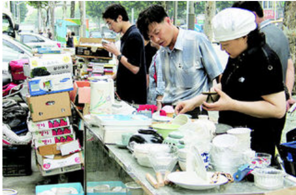
그림 15: 흠서점

둔 책이 다음에 오면 대부분 없다”고 말했다. 그는 책 다섯 권 값을 치른 뒤 뒤 돌아보다 그예 책 한 권을 더 집어들었다. 아이 책을 고르던 한 주부는 “책값이 걱정하다”면서 “그런 만큼 자주 와야 마음에 드는 책을 구할 수 있다”고 말했다.