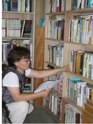
그림 10: 대방 헌책음반 사고팔고